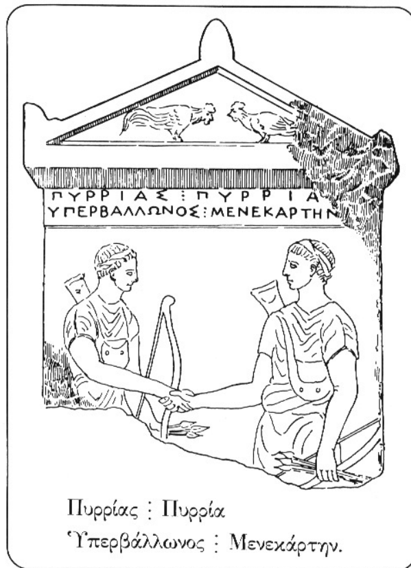
Сл.15 Какодики, Бела Планина