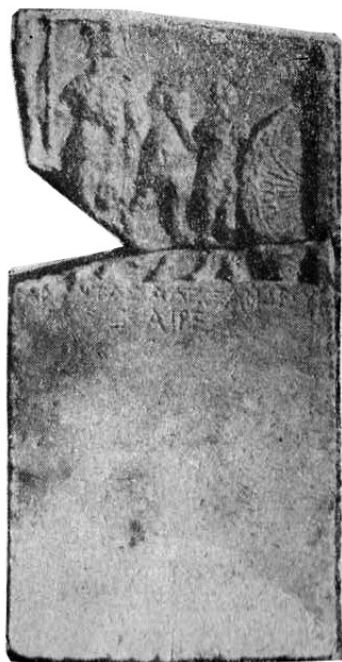
Сл.4 Требенишко Кале